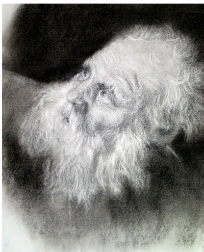
Rembrandt, Abraham, detail uit Het offer van Izaak