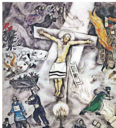
Marc Chagall, russisch-joodse schilder 20 e eeuw

Laat ik alvast één blik vooruitwerpen op de conclusie. Ik meen dat christenen wel via één of meerdere van deze vijf betekenissen met Israel verbonden zijn, maar alleen in de vijfde betekenis onopgeefbaar verbonden, al ligt zelfs daar een clause. In artikel I van onze kerkorde lijken de eerste vier betekenissen wel degelijk óók bedoeld. Ik hoop te laten zien dat verbondenheid met Israel in elk van deze betekenissen eigen condities stelt, en dat we dit van het Oude Testament al leren. Opvallend is, dat de meeste recente publicaties expliciet of impliciet de eerste betekenis van 'Israel' aanhouden (vaak samen met de tweede, derde en vierde) en wel in actuele zin, om zich dan af te vragen of de kerk met dat Israel onvoorwaardelijk solidair moet zijn. Alle publicaties die ik ken menen, dat 'Israel' in de eerste betekenis (vaak samen met de tweede, derde en vierde) in het Oude Testament het volk van God was. Punt van discussie is dan alleen nog, of het dat nog steeds is. Ik denk dat hiermee de discussie van meet af aan op een verkeerd been is gezet.