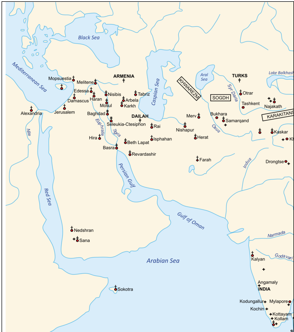
Christelijk Midden-Oosten en Zuid-Azië in de vroege middeleeuwen